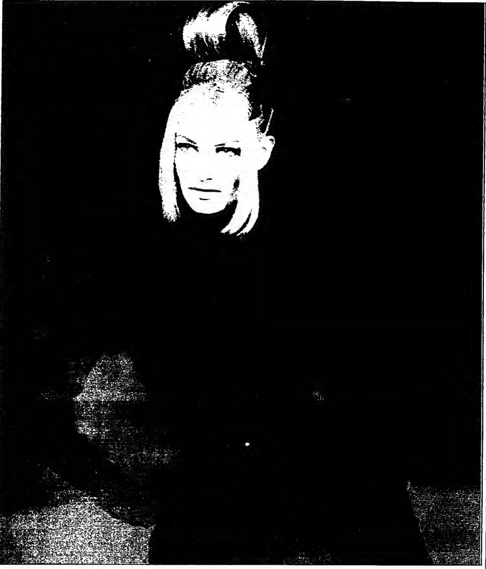
باريس - القدس العربي